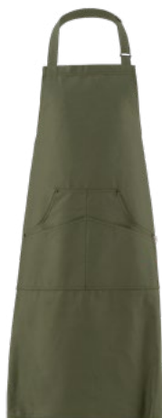
102 Verde militare