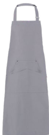
019 Grigio chiaro